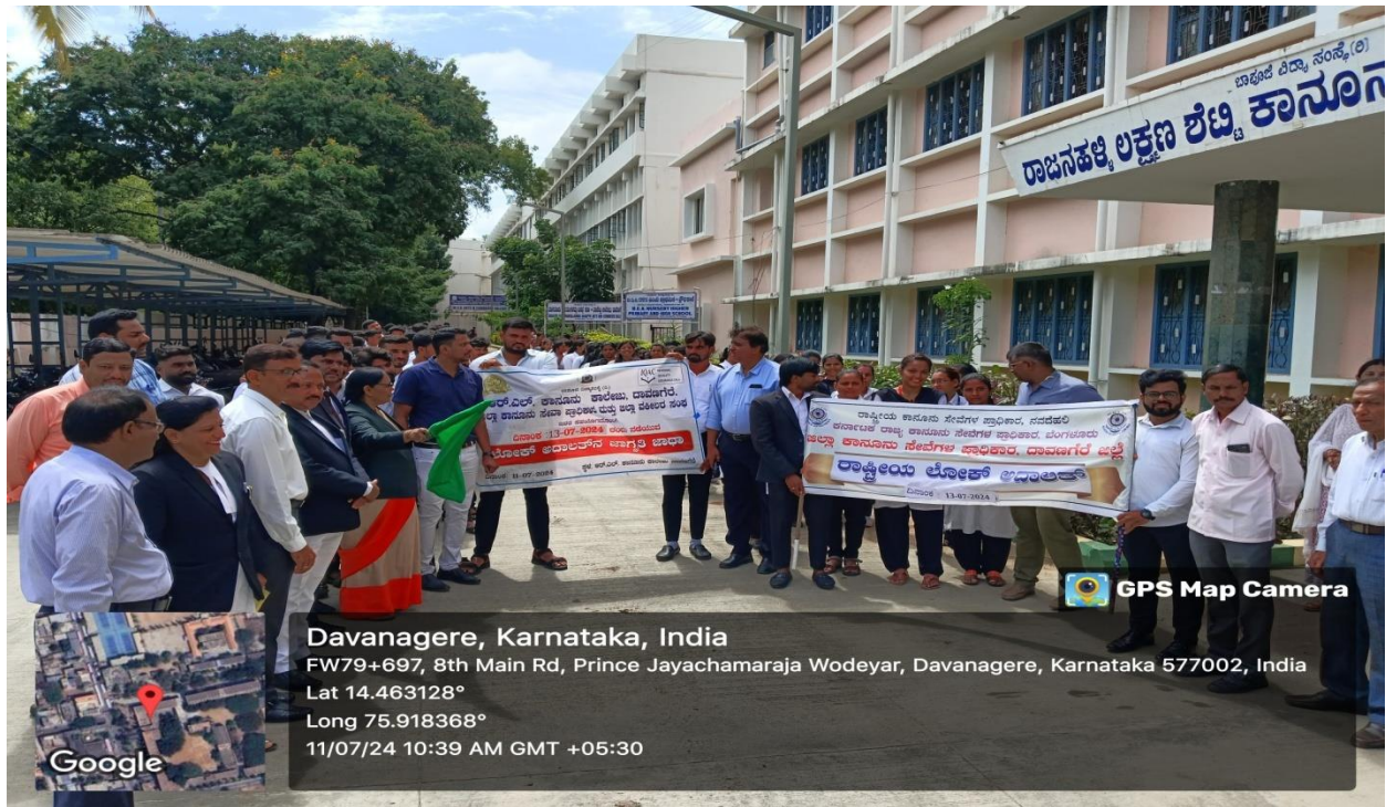
FLAGGING OFF OF THE PROGRAMME